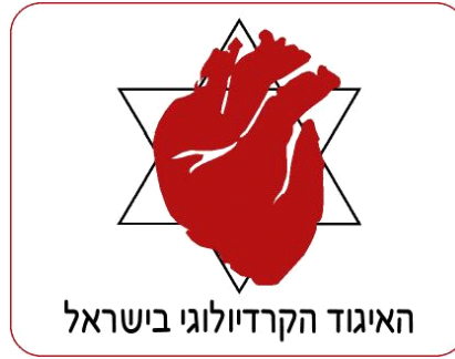
האיגוד הקרדיולוגי בישראל